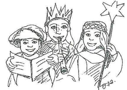
Die Sternsinger kommen

Schneeflocken, die vorwitzig auf deiner Nase tanzen, lassen dich jener liebenswerte Mensch sein, der du in der Tiefe deines Inneren bist.